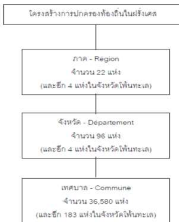
ภาพประกอบที่ 2.2 โครงสร้างการปกครองท้องถิ่นภายในสาธารณรัฐฝรั่งเศส

(2) การปกครองนอกแผ่นดินใหญ่ (mainland) ประกอบด้วย เกาะ Cosica, จังหวัดโพ้นทะเล (DOM), และดินแดนโพ้นทะเล (TOM)