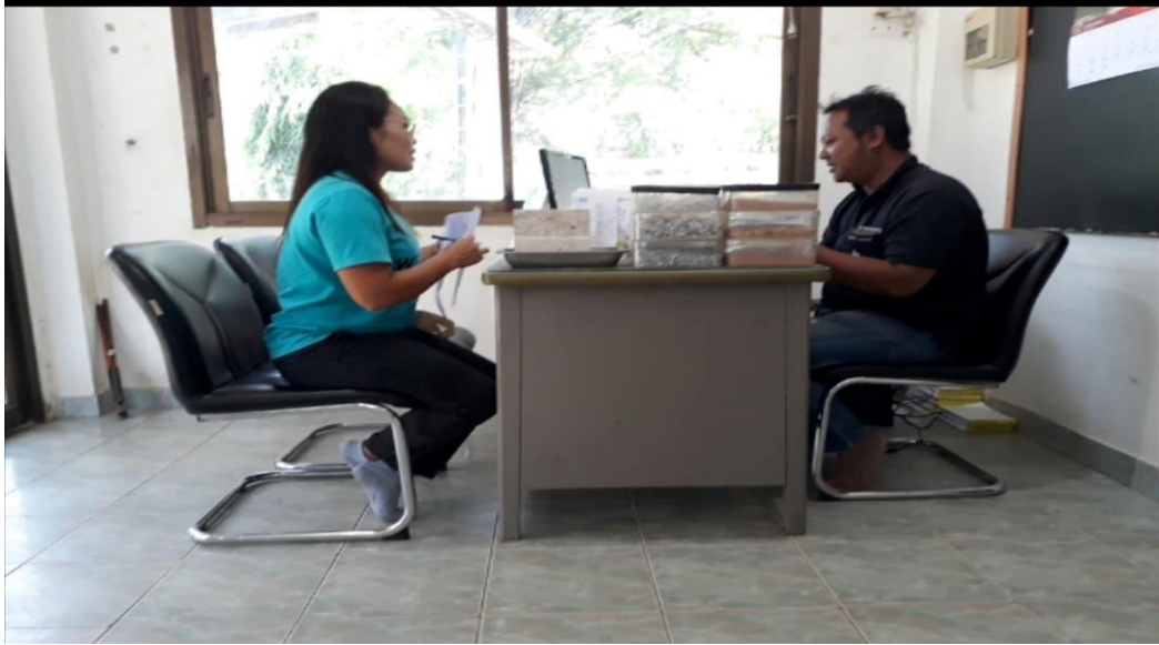
ภาพที่ 3 กิจกรรมลงพื้นที่