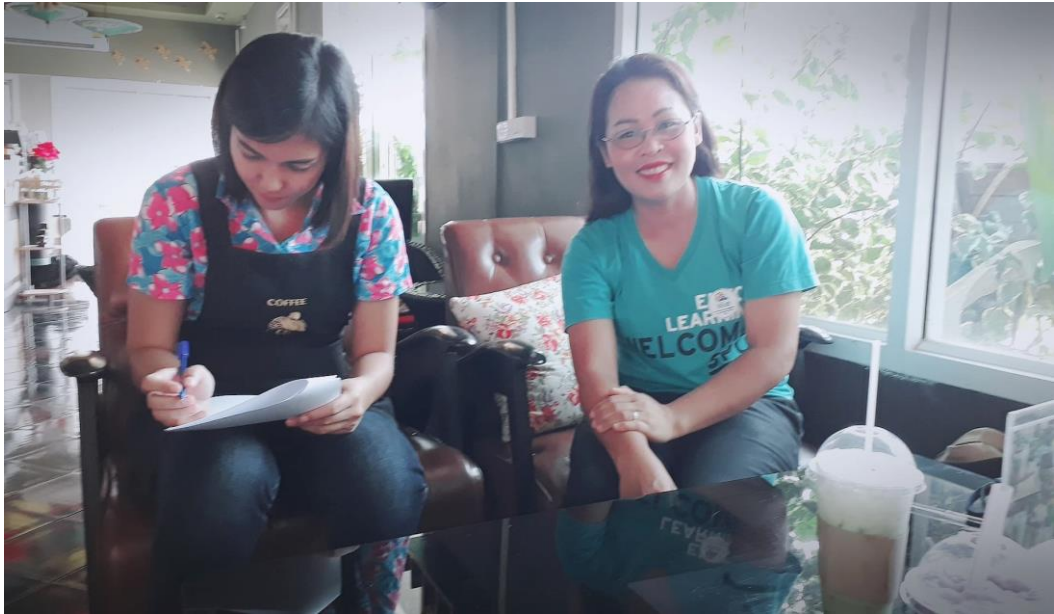
ภาพที่ 5 กิจกรรมลงพื้นที่