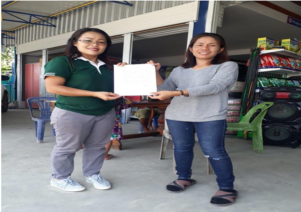
ภาพที่ 8 กิจกรรมลงพื้นที่