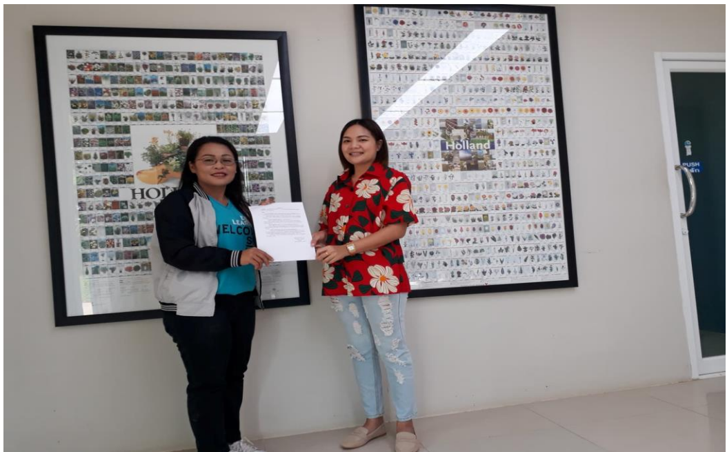
ภาพที่ 6 กิจกรรมลงพื้นที่