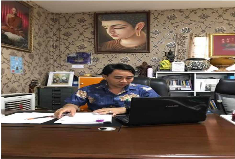
ภาพที่ 1 กิจกรรมลงพื้นที่