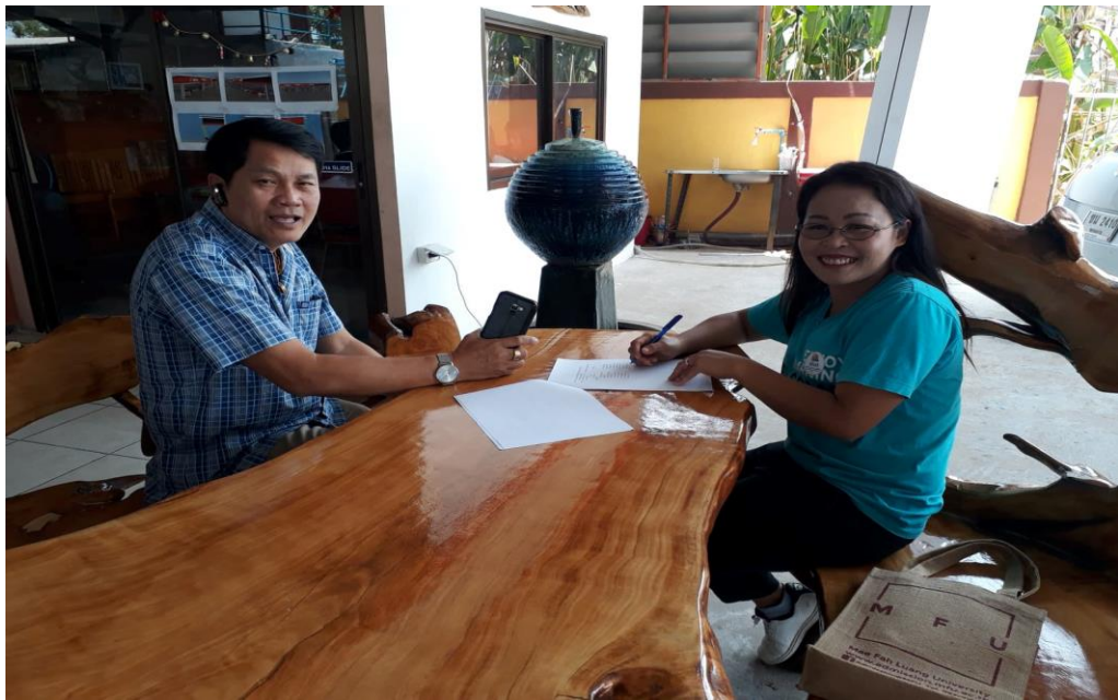
ภาพที่ 4 กิจกรรมลงพื้นที่