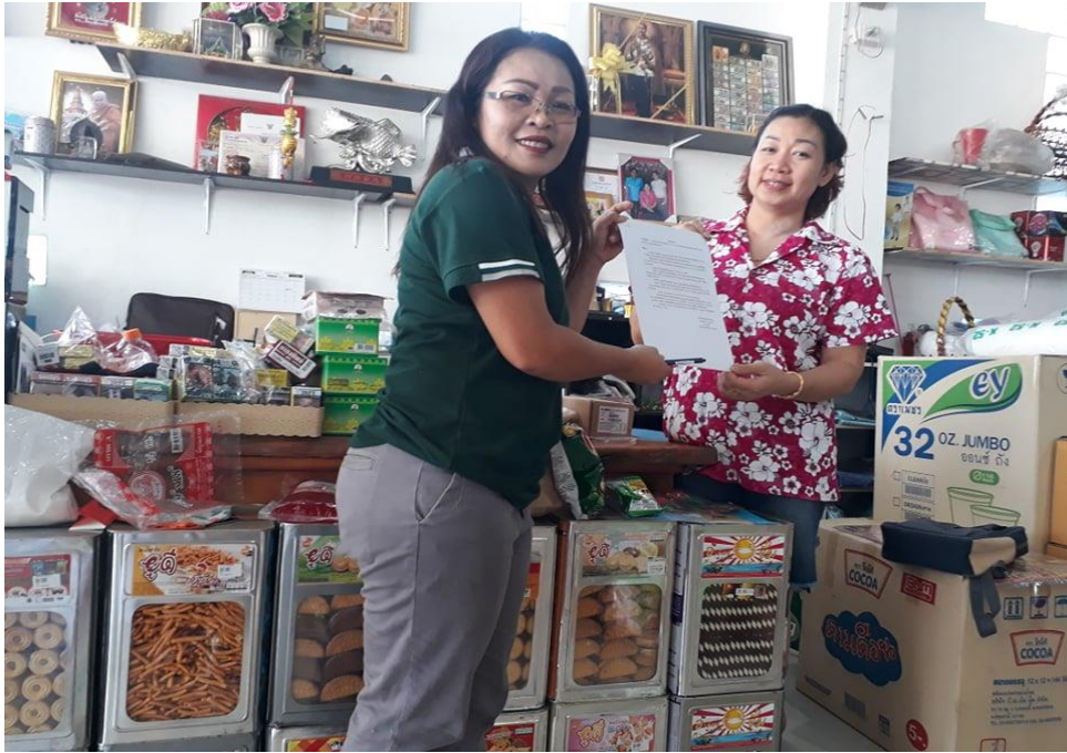
ภาพที่ 7 กิจกรรมลงพื้นที่