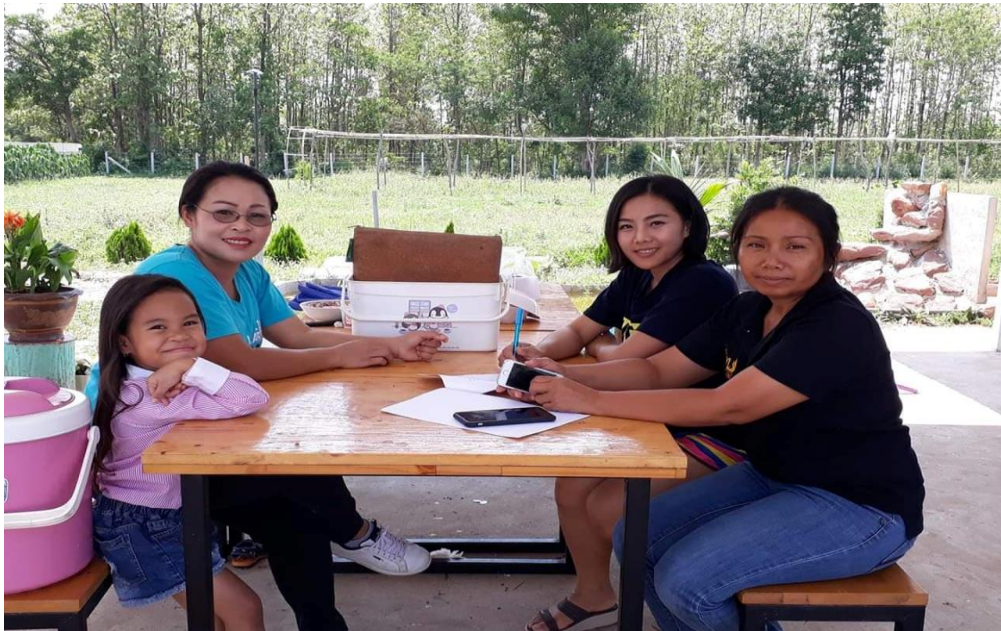
ภาพที่ 2 กิจกรรมลงพื้นที่