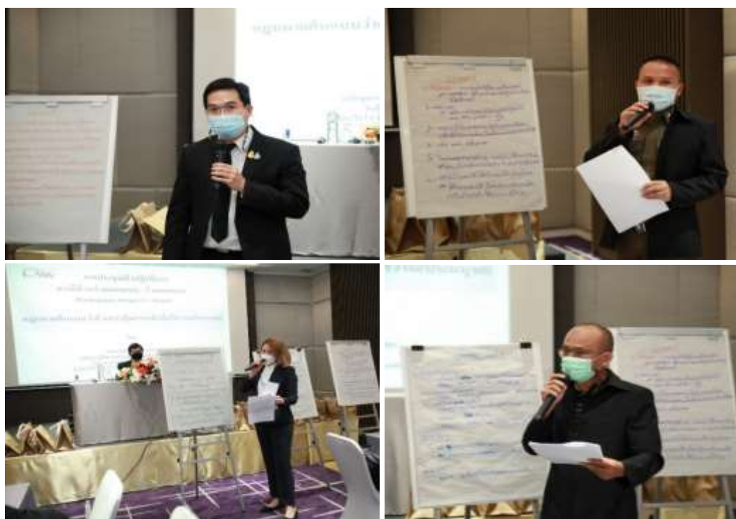
ภาพประกอบที่ 3.8 ภาพกลุ่มผสมนำเสนอ

ขั้นตอนที่ 4 จัดกลุ่มประชากรใหม่อีกครั้งเป็นกลุ่มประชากรผสมที่มาจากตัวแทนของประชากรกลุ่มเฉพาะมารวมเป็นกลุ่มใหม่ ได้ 4 กลุ่ม และดำเนินการเช่นเดียวกับขั้นตอนที่ 1 - 3