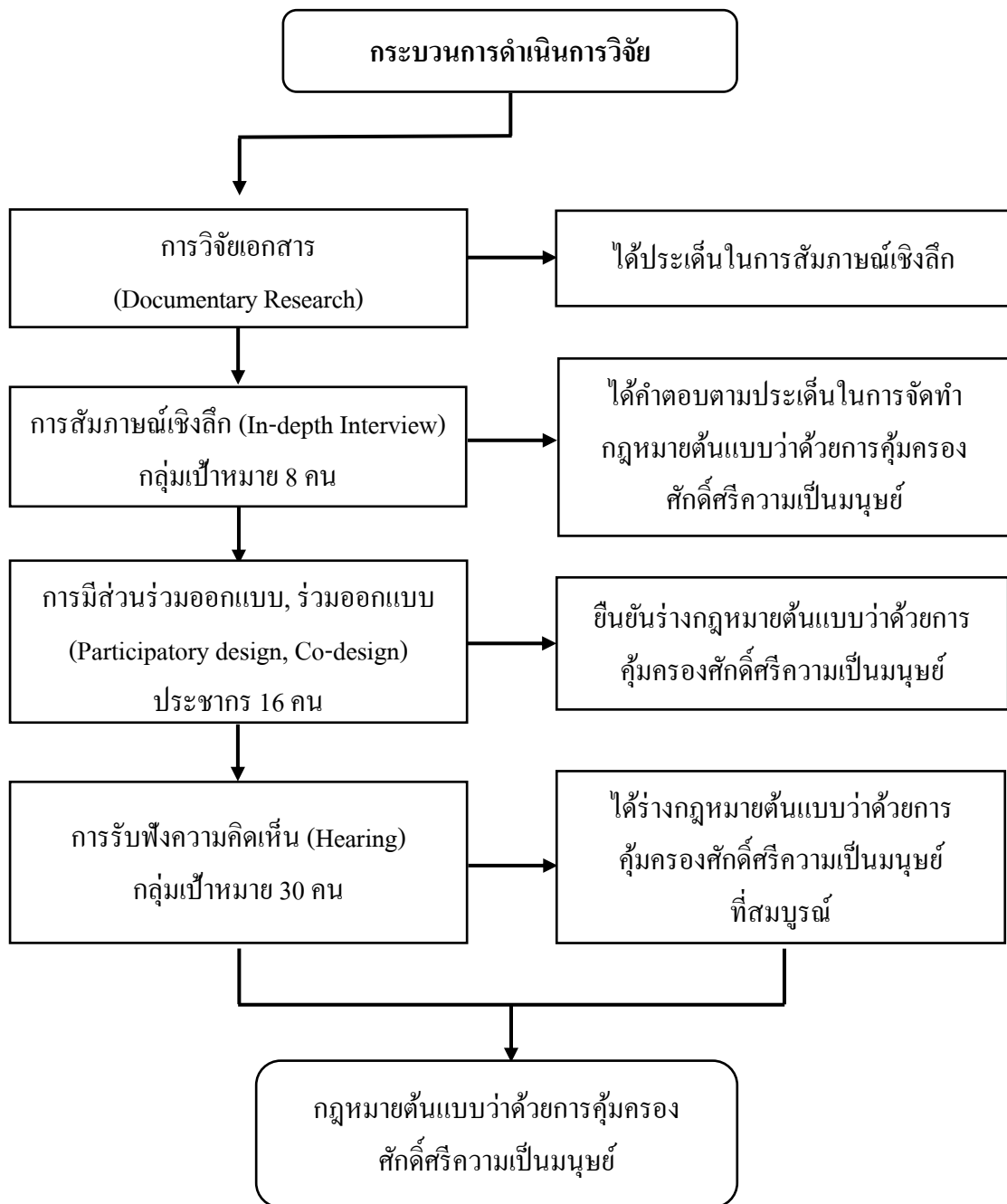
ภาพประกอบที่ 3.10 กระบวนการวิวิทย์การวิจัย