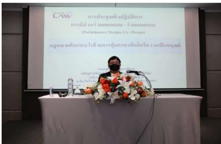
ภาพประกอบที่ 3.5 การจัดสัมมนาการมีส่วนร่วมออกแบบ

การเตรียมความพร้อม ด้วยการกำหนดประชากรผู้มีส่วนได้ส่วนเสียที่เกี่ยวข้องกับการคุ้มครองศักดิ์ศรีความเป็นมนุษย์ในแต่ละส่วนงาน และมีหนังสือเชิญประชากรให้เข้ามีส่วนร่วมออกแบบ สำหรับสถานที่เป็นห้อง สำหรับอุปกรณ์ที่ใช้ในการออกแบบประกอบด้วย กระดาษ สำหรับเขียนคำตอบ เพื่อนำเสนอต่อที่ประชุมกลุ่มทุกกลุ่ม ปากกาสำหรับเขียนคำตอบ และเลขาประจำกลุ่มที่จะทำหน้าที่จดประเด็นคำตอบจากกลุ่มเฉพาะและกลุ่มผสม