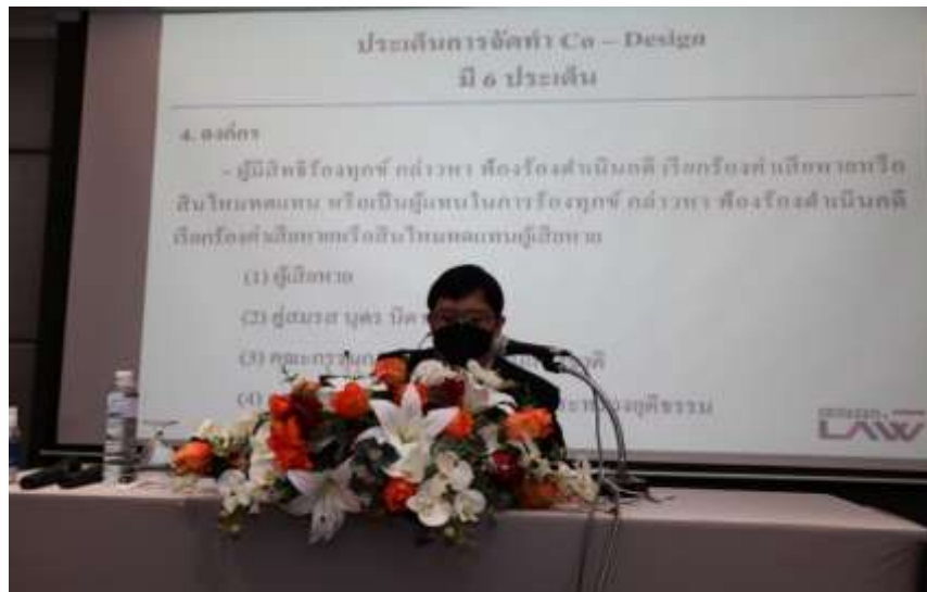
ภาพประกอบที่ 3.6 การนำเสนอของผู้วิจัย

ขั้นตอนที่ 2 ให้แต่ละกลุ่มเฉพาะ 4 กลุ่มในชุดแรก แยกกันดำเนินการร่วมออกแบบด้วยการแลกเปลี่ยนความคิดเห็น อภิปรายร่วมกัน พร้อมหาข้อยุติของคำตอบของกลุ่มในแต่ละประเด็นที่กำหนดไว้ โดยมีผู้วิจัยอยู่ประจำแต่ละกลุ่ม ที่น่าจะอำนวยความสะดวกในการจดเนื้อความที่ได้จากการออกแบบของแต่ละกลุ่ม เป็นคำตอบจากการตกลงร่วมกันภายในกลุ่มนั้น ๆ