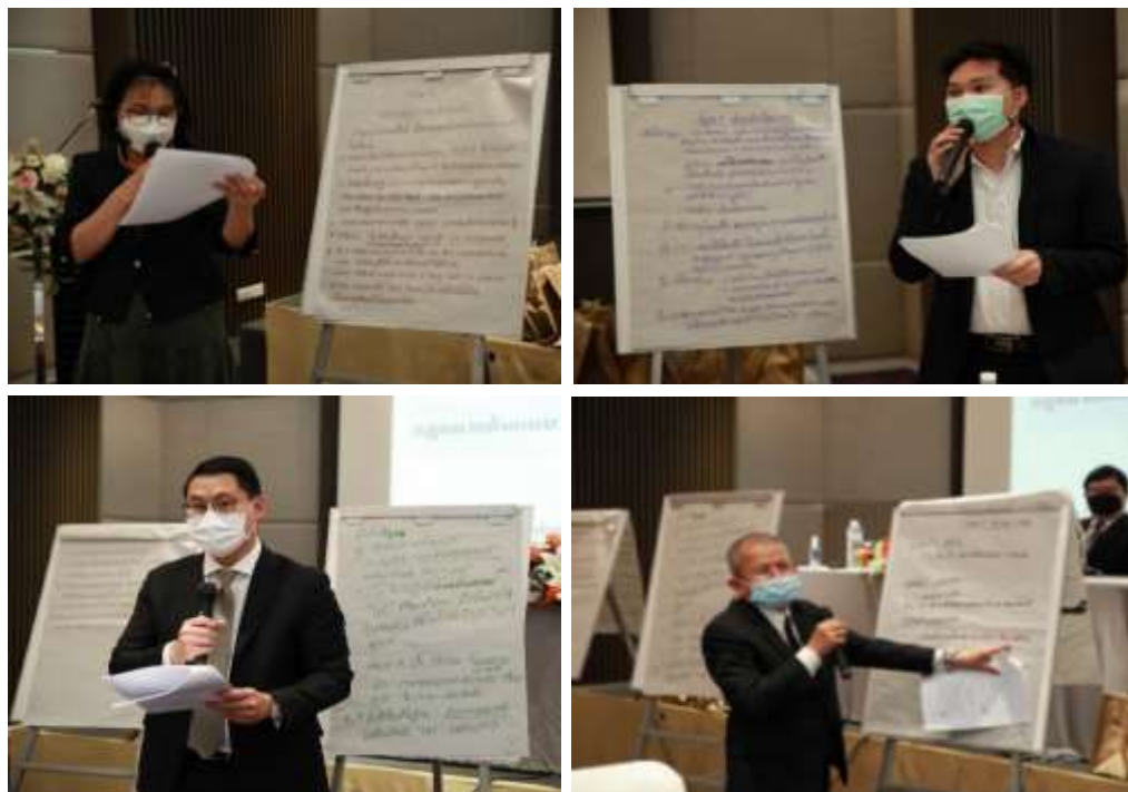
ภาพประกอบที่ 3.7 ภาพกลุ่มเฉพาะนำเสนอผล

ขั้นตอนที่ 3 ให้ผู้แทนแต่ละกลุ่มประชากรเฉพาะ นำเสนอรูปแบบที่จัดทำขึ้นมาแล้วต่อที่ประชุมเพื่อรับฟังและรับรู้รูปแบบของกลุ่มตน