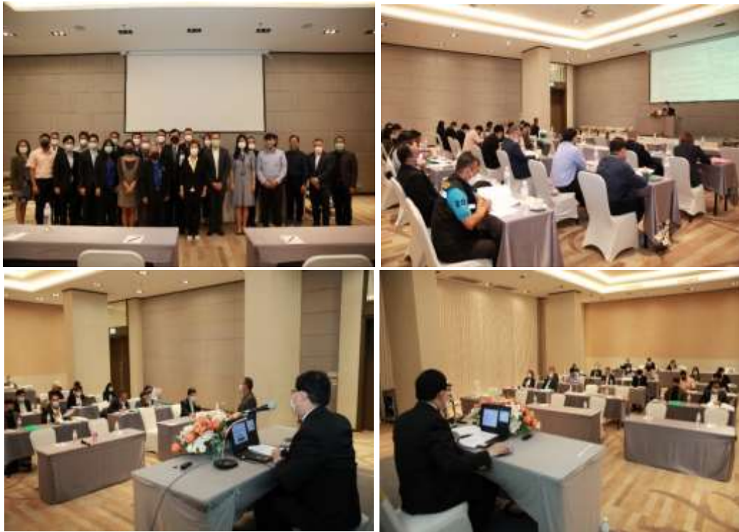
ภาพประกอบที่ 3.9 การสัมมนารับฟังความคิดเห็น

ข้อมูลทั้งหมดที่ได้จากการเก็บรวบรวมตามวิธีวิทยาการวิจัยที่กำหนดไว้ดังกล่าวแล้วนั้น จะนำไปสู่การวิเคราะห์เพื่อการจัดทำกฎหมายต้นแบบว่าด้วยการคุ้มครองศักดิ์ศรีความเป็นมนุษย์