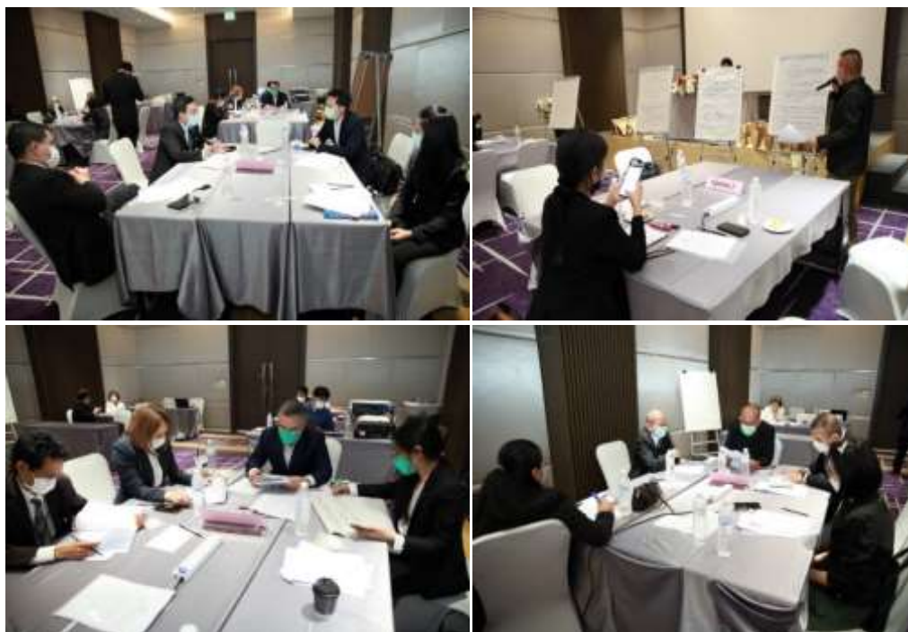
ภาพประกอบที่ 3.4 ประชากรกลุ่มผสม 4 กลุ่ม