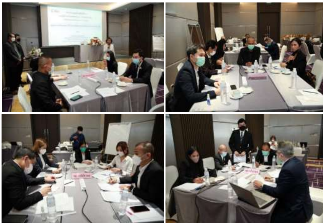
ภาพประกอบที่ 3.2 ประชากรกลุ่มเฉพาะ 4 กลุ่ม