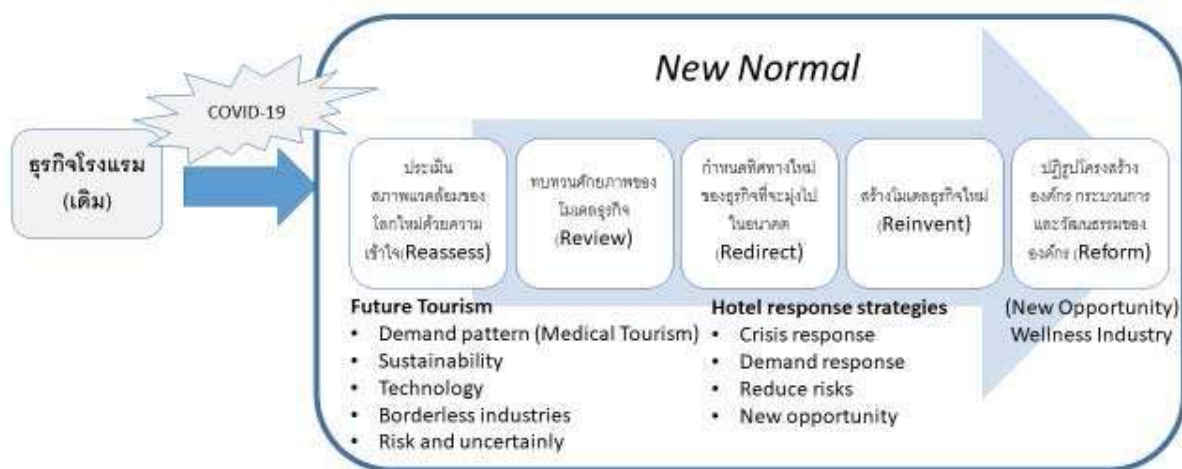
ภาพที่ 3 แนวทางในการปรับตัวของธุรกิจโรงแรมสู่ธุรกิจเพื่อสุขภาพ