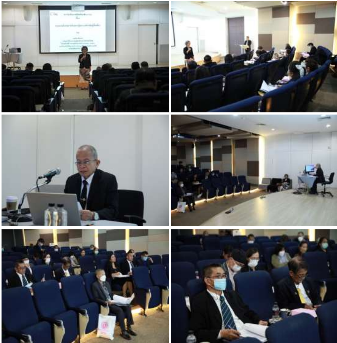
ภาพที่ 2 การรับฟังความคิดเห็น (Hearing)