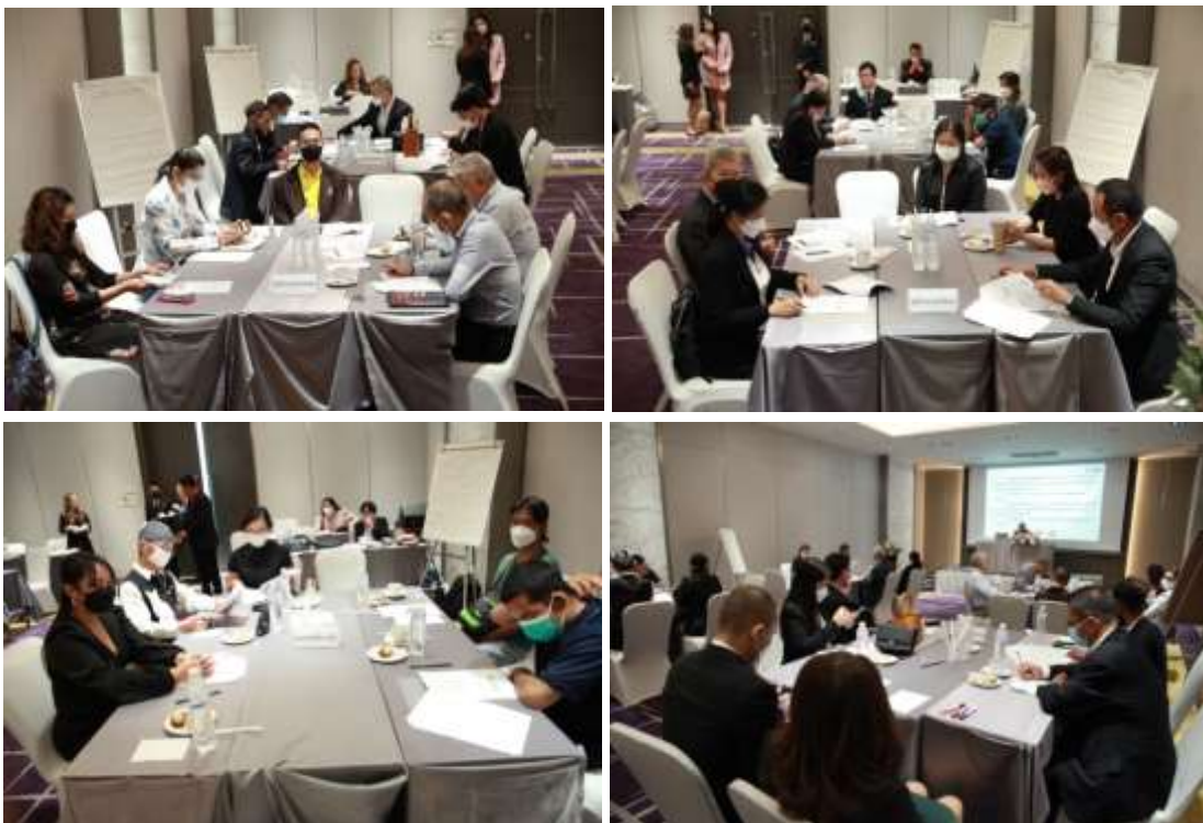
ภาพที่ 2 การมีส่วนร่วมออกแบบ Co-design