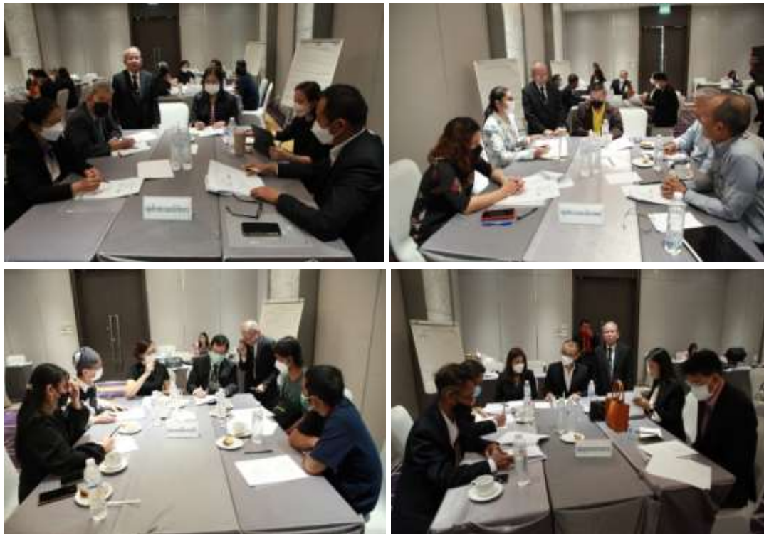
ภาพที่ 3 การจัดทำ Co-Design (ประชากรกลุ่มเฉพาะ)