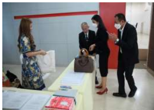
ภาพที่ 1 ผู้เข้าร่วมรับฟังความคิดเห็น (Hearing)