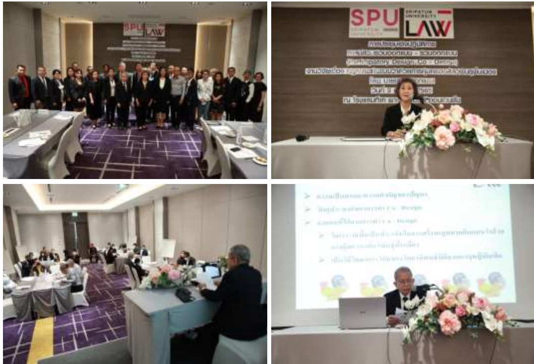
ภาพที่ 1 การจัดทำ Co-Design