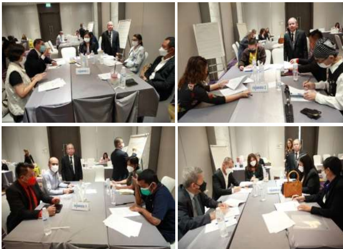
ภาพที่ 4 การจัดทำ Co-Design (ประชากรกลุ่มผสม)