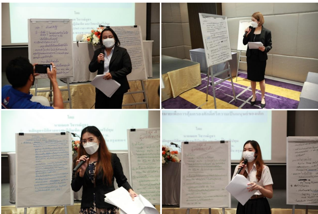
ภาพประกอบที่ 3.7 ภาพกลุ่มเฉพาะนำเสนอผล

ขั้นตอนที่ 3 ให้ผู้แทนแต่ละกลุ่มประชากรเฉพาะ นำเสนอรูปแบบที่จัดทำขึ้นมาแล้วเสนอต่อที่ประชุมเพื่อรับฟังและรับรู้รูปแบบของกลุ่มตน