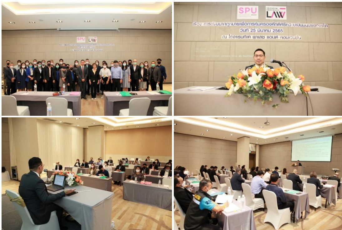
ภาพประกอบที่ 3.9 การสัมมนารับฟังความคิดเห็น

ข้อมูลทั้งหมดที่ได้จากการเก็บรวบรวมตามวิธีวิทยาการวิจัยที่กำหนดไว้ดังกล่าวแล้วนั้น จะนำไปสู่การวิเคราะห์เพื่อจัดทำกฎหมายต้นแบบว่าด้วยการคุ้มครองศักดิ์ศรีความเป็นมนุษย์ของเด็ก โดยการปรับปรุงแก้ไขพระราชบัญญัติคุ้มครองเด็ก พ.ศ. 2546