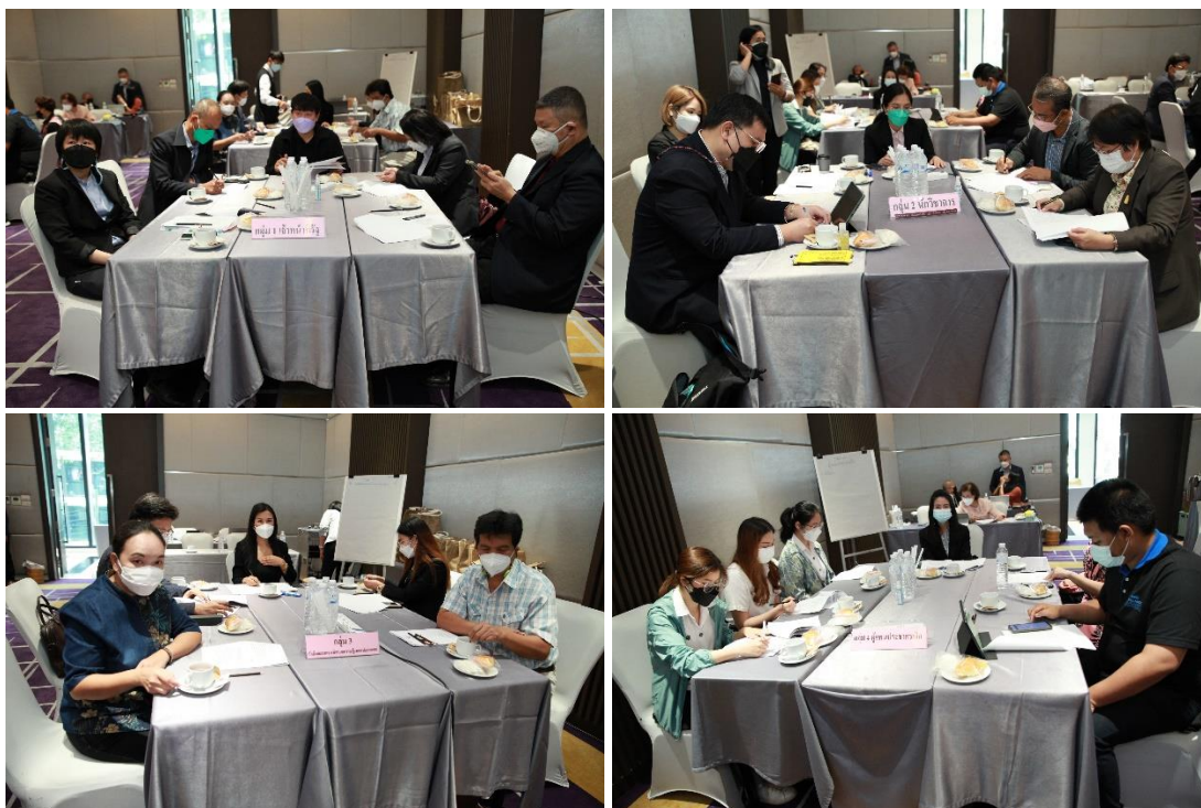
ภาพประกอบที่ 3.2 ประชากรกลุ่มเฉพาะ 4 กลุ่ม

กลุ่มประชากรเฉพาะมี 4 กลุ่ม แต่ละกลุ่มจะร่วมกันอภิปรายแสดงความคิดเห็นและความต้องการที่จะให้มีในการพัฒนากฎหมายเพื่อการคุ้มครองศักดิ์ศรีความเป็นมนุษย์ของเด็กตามแต่ประสบการณ์ที่มีอยู่ แต่จะเป็นต้นแบบที่มาจากกลุ่มผู้มีส่วนได้เสียกลุ่มเดียวกัน ดังนั้นต้นแบบที่จะได้จึงมาจากผู้มีส่วนได้เสียทั้ง 4 กลุ่มเฉพาะ ซึ่งอาจจะเหมือนหรือแตกต่างกันก็ได้