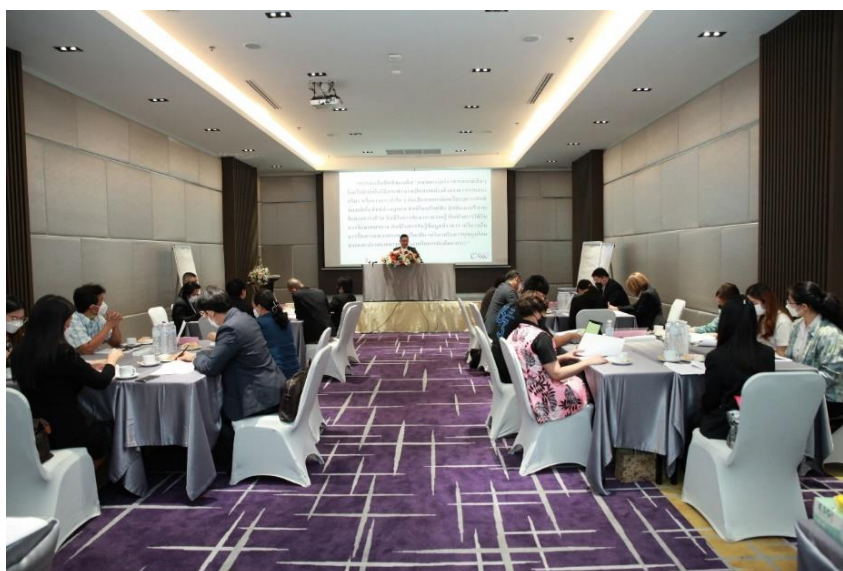
ภาพประกอบที่ 3.6 ภาพนำเสนอ

ขั้นตอนที่ 1 ผู้วิจัยนำเสนอข้อค้นพบของงานวิจัยและประเด็น โครงสร้างของกฎหมาย เพื่อกำหนดให้เป็นประเด็นที่เป็นหัวข้อสำหรับให้กลุ่มประชากรที่กำหนดไว้ร่วมออกแบบตามหัวข้อที่กำหนด