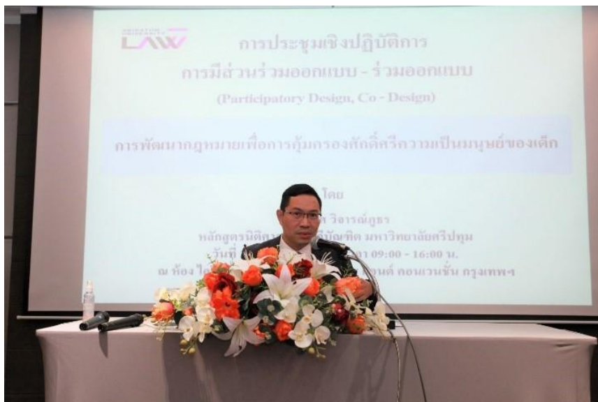
ภาพประกอบที่ 3.5 การจัดสัมมนาการมีส่วนร่วมออกแบบ

การดำเนินการดังกล่าวแบ่งเป็น 2 ช่วง คือ ช่วงเช้า เป็นการมีส่วนร่วมออกแบบของกลุ่มประชากรเฉพาะ 4 กลุ่ม ช่วงบ่าย เป็นกลุ่มประชากรผสม 4 กลุ่ม ทั้ง 2 ช่วงแม้กลุ่มประชากรจะแตกต่างกัน แต่ก็ใช้ประเด็นหรือหัวข้อที่จะให้ออกแบบเดียวกัน การดำเนินการทั้ง 2 ช่วงเวลาดังกล่าวจะมีการเลือกประธานกลุ่ม เพื่อทำหน้าที่นำเสนอคำตอบของกลุ่มตนต่อที่ประชุม โดยมีรายละเอียดของการดำเนินการมี ดังนี้