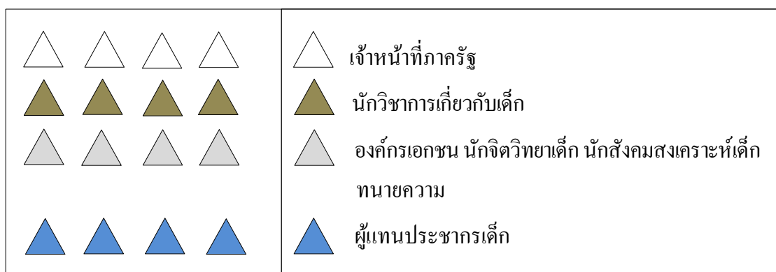
ภาพประกอบที่ 3.1 ภาพกลุ่มประชากรกลุ่มเฉพาะ

กลุ่มประชากรเฉพาะมี 4 กลุ่ม แต่ละกลุ่มจะร่วมกันอภิปรายแสดงความคิดเห็นและความต้องการที่จะให้มีในกฎหมายเพื่อการคุ้มครองศักดิ์ศรีความเป็นมนุษย์ของเด็กตามแต่ประสบการณ์ที่มีอยู่ดังนั้นต้นแบบที่จะได้จึงมาจากผู้มีส่วนได้เสียทั้ง 4 กลุ่มเฉพาะ ซึ่งอาจจะเหมือนหรือแตกต่างกันก็ได้ (ดูภาพประกอบที่ 3.1)