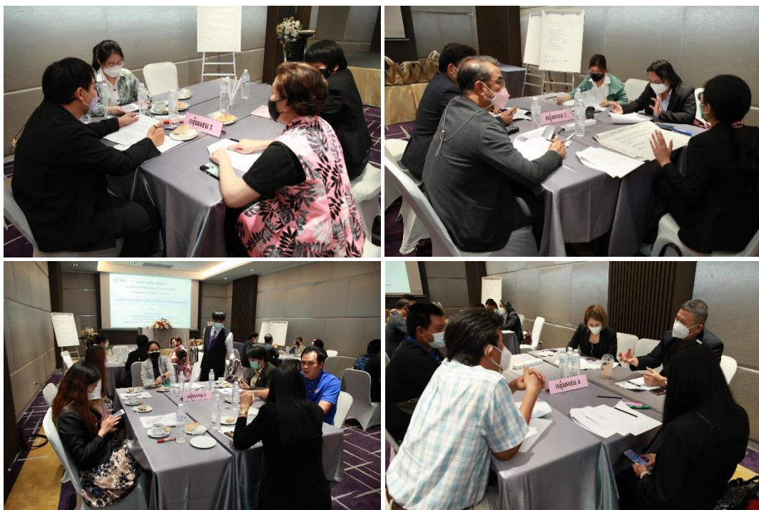
ภาพประกอบที่ 3.4 ประชากรกลุ่มผสม 4 กลุ่ม

หลักการและเหตุผลของการมีกลุ่มผสม คือ การให้ผู้มีส่วนได้เสียที่มีประสบการณ์แตกต่างกันมาร่วมอภิปรายตามความคิดเห็นของแต่ละฝ่าย ซึ่งอาจสอดคล้องกันหรือแตกต่างกันก็ได้แต่ในแต่ละกลุ่มจะต้องมีข้อสรุปของกลุ่ม