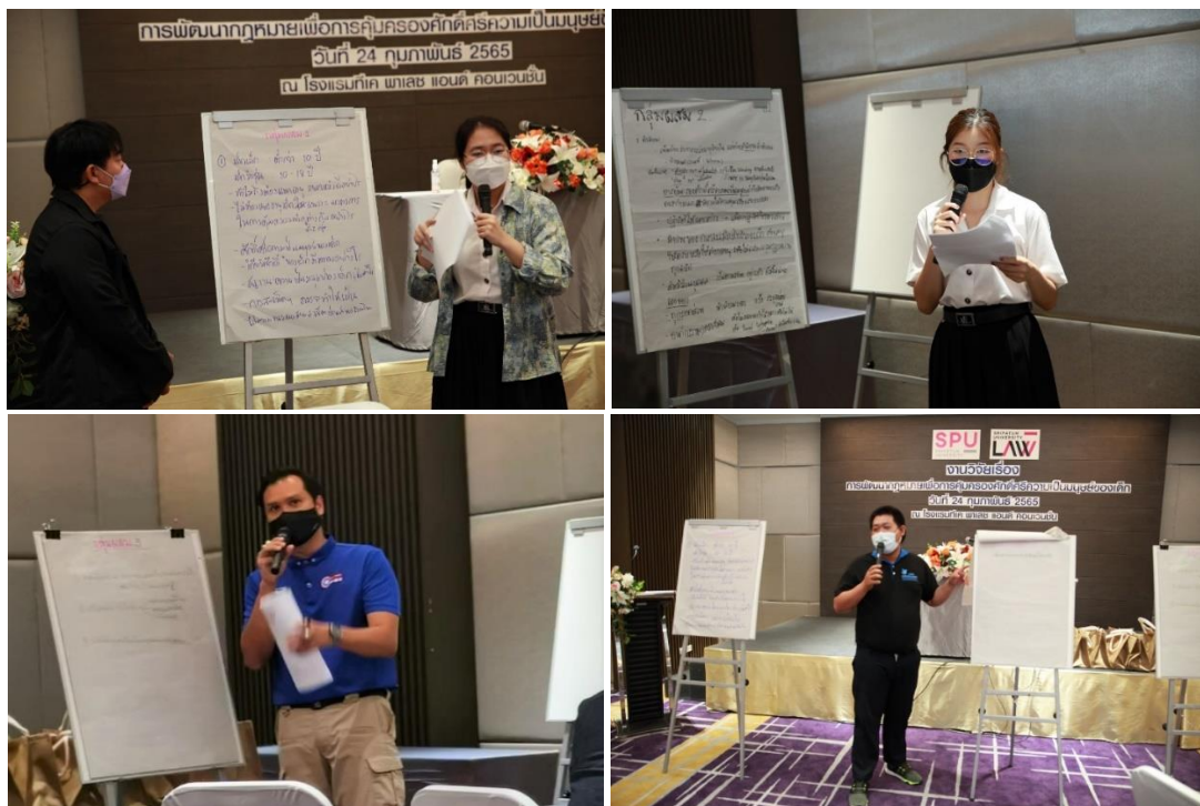
ภาพประกอบที่ 3.8 ภาพกลุ่มผสมนำเสนอผล