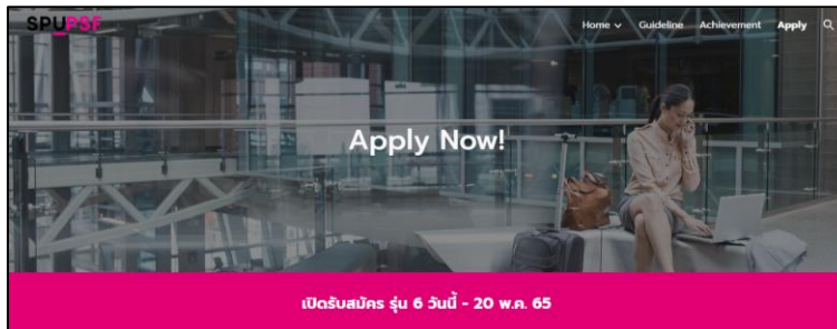
ภาพที่ 4 หน้าจอแสดงเมนู Apply