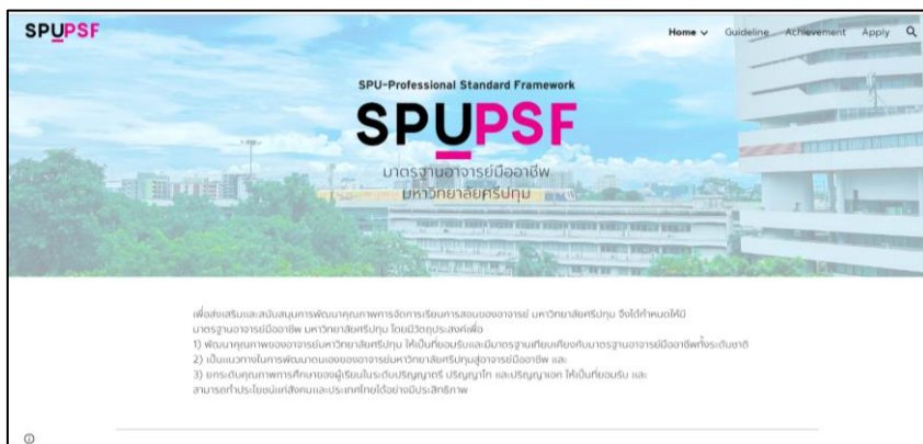
ภาพที่ 1 หน้าจอแสดงเมนูหลัก Home

ผู้วิจัยได้พัฒนาเว็บไซต์มาตรฐานอาจารย์มืออาชีพ มหาวิทยาลัยศรีปทุม โดยประกอบ 4 เมนูหลัก 2 เมนูย่อย ได้แก่ เมนู Home เมนู Guideline เมนู Achievement เมนู Apply เมนูย่อย News และเมนูย่อย Download โดยเว็บไซต์ดังกล่าว คณะผู้วิจัยได้ออกแบบให้มีความเรียบง่าย สวยงาม มีความน่าสนใจ มีความทันสมัย และสามารถใช้งานง่าย ไม่ซับซ้อน (Link website: https://sites.google.com/spu.ac.th/spu-psf/home ) ดังแสดงในภาพที่ 1-4