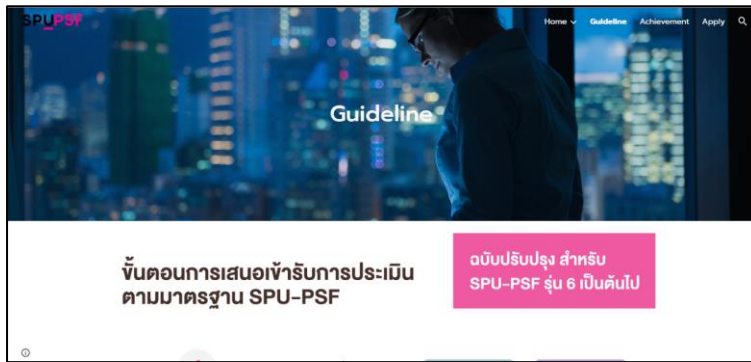
ภาพที่ 2 หน้าจอแสดงเมนู Guideline