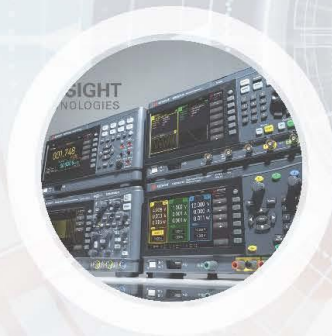
Education Series : Oscilloscope, Power Supply, Function Generator and DMM