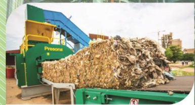
การคัดแยกแปรรูปขยะชุมชน เป็นเชื้อเพลิงแข็งทดแทน (RDF)