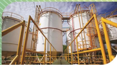
บริการกำจัดกากอุตสาหกรรม ด้วยวิธีเผาพร้อมในเตาผลิตปูนซีเมนต์