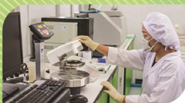
บริการด้านการตรวจวัด วิเคราะห์ด้านสิ่งแวดล้อม