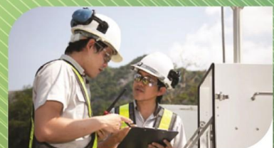
บริการให้คำปรึกษา ด้านสิ่งแวดล้อม