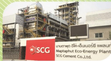
บริการกำจัดกากอุตสาหกรรม ด้วยการเผาเอาพลังงานจากขยะอุตสาหกรรม เพื่อใช้ผลิตกระแสไฟฟ้า