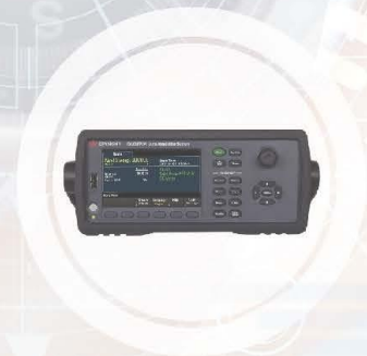
Data Acquisition Unit