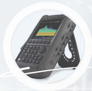
FieldFox Handheld RF and Microwave Analyzers

ACCREDITED ISO/IEC17025 BY THAI INDUSTRIAL STANDARDS INSTITUTION (TISI)