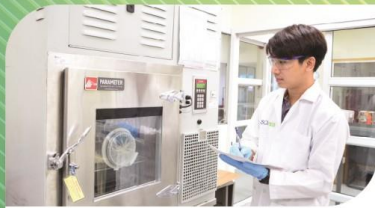
บริการสอบเทียบ เครื่องมือทุกประเภท