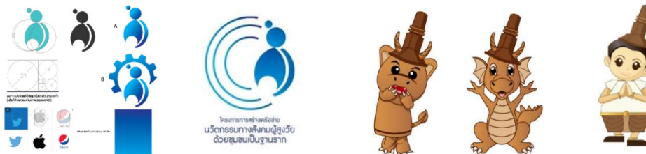
ภาพที่ 2 การสร้างภาพลักษณ์ โดยออกแบบตราสัญลักษณ์โลโก้ (Logo) ตุ๊กตาสัญลักษณ์ (Mascot) ที่มา: รณิดา นุชนิยม, 2564

พัฒนาการข้อมูลเกี่ยวกับชุมชนผู้สูงอายุ การคัดเลือกแนวคิดในการสร้างแนวคิดเพื่อสร้างเครือข่ายทีมงานผู้วิจัยและทีมผู้เชี่ยวชาญ ได้ร่วมกันคัดเลือกแนวคิด และแสดงความคิดเห็น เรื่องการตั้งชื่อ การออกแบบตราสัญลักษณ์ หรือโลโก้ (Logo) และการสร้างภาพลักษณ์ด้วยตุ๊กตาสัญลักษณ์ (Mascot) ดังภาพที่ 2