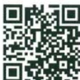
QR Code แบบสอบถาม