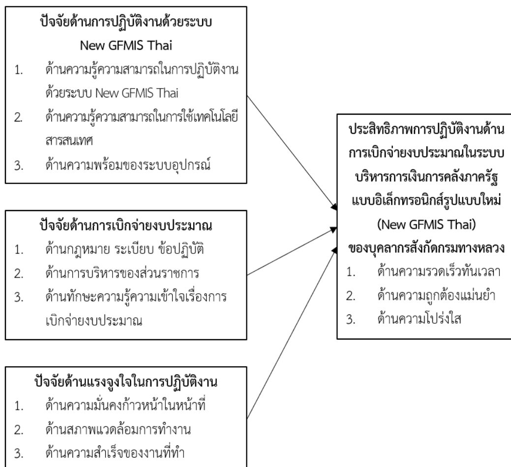
ภาพประกอบที่ 1 กรอบแนวคิดของการวิจัย (Conceptual Framework)