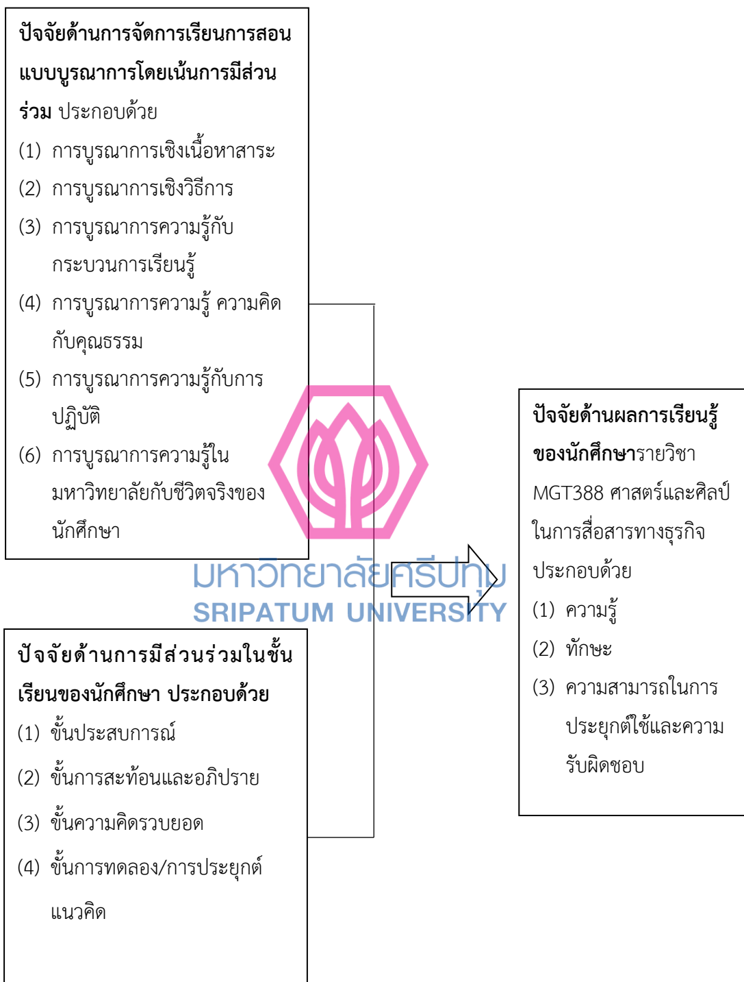
ภาพที่ 1.1 กรอบแนวคิดในการวิจัย