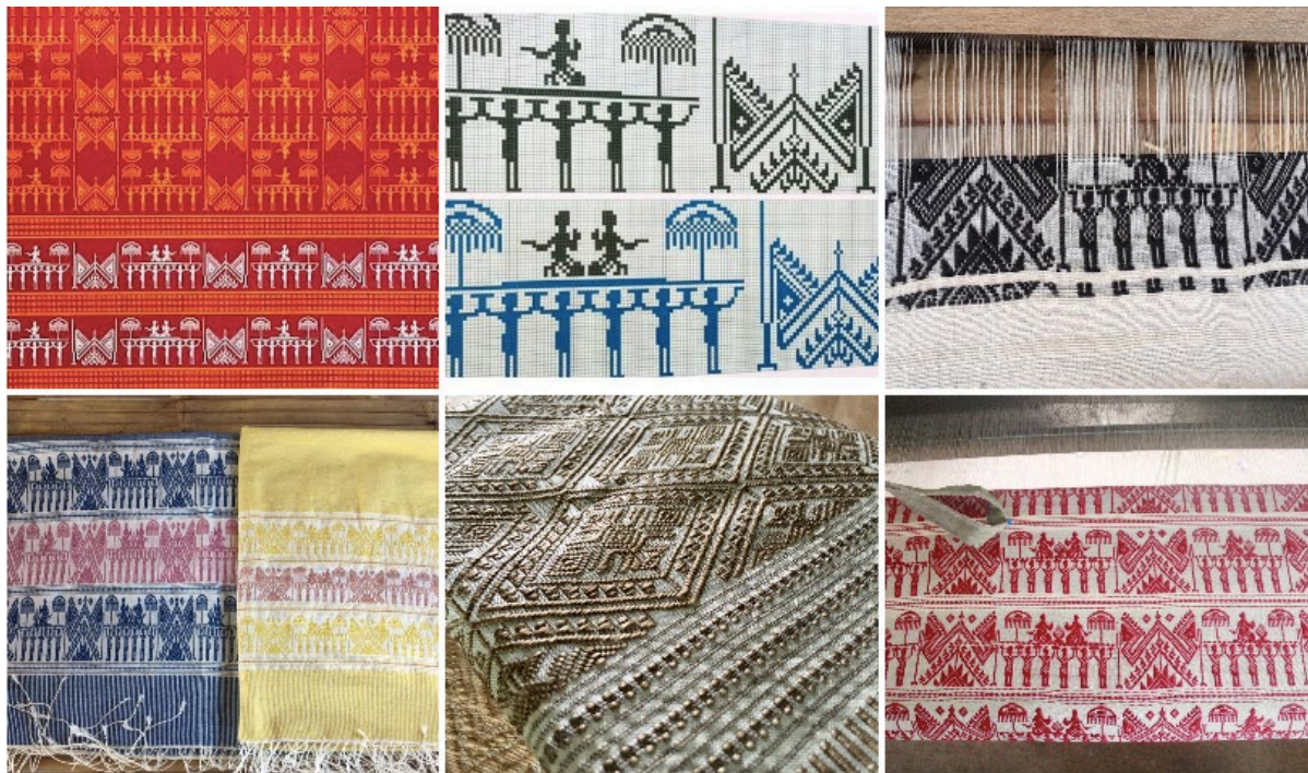
ภาพประกอบที่ 6.9.1 ผ้าทอซิด ชุมชนโนนเสลา

และบ้านตลาดทราย ต.บ้านหัน ส่วนเส้นขัดหรือเส้นลวง เพื่อทอขัดลายซิดให้อยู่และมีหน้าที่ซับซ้อนซิดให้ซิดมากขึ้น ใช้ทั้งเส้นฝ้ายเส้นเล็ก ๆ เส้นฝ้ายดิบโรงงาน Cotton10/1 และใช้ไหมที่ล้างขาวแล้วหรือย้อมสีอ่อน ๆ โดยสัดส่วนที่ใช้ เส้นยืนกับเส้นขัดและเส้นสีหลัก จะตกราว ๆ 25 - 30 /70 เปอร์เซ็นต์ โดยน้ำหนัก สำหรับฝ้าย ส่วนไหม จะแยกเส้นยืนและเส้นสีหลักกับเส้นขัด จะตกราว ๆ 10/90 เปอร์เซ็นต์ โดยน้ำหนัก