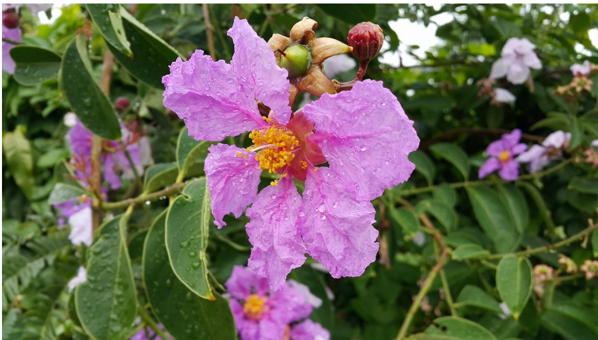
รูปภาพที่ 2.1 ดอกกาะเลา, กาสেলা, อินทนิลบก