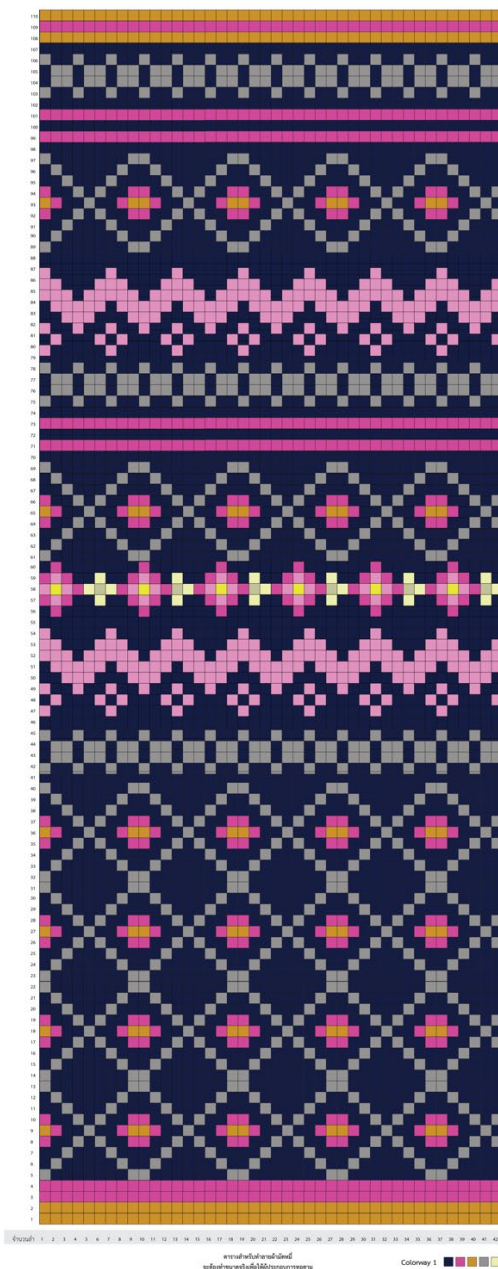
ลายดอกกระเลา 1 : ลวดลายนี้ผู้วิจัยได้แรงบันดาลใจมาจากเรื่องราวของประวัติชุมชนบ้านโนนเสลา ที่เรียกกันผิดเพี้ยนมากันต่อเนื่องจากคำว่า โนนเสลา มาจากต้นกระเลา ที่มีดอกสีม่วงอมชมพู มีเกสรสีเหลือง ผู้วิจัยจึงนำเรื่องราวนี้มาออกแบบตารางลำผ้าเพื่อให้ชาวบ้านได้ทอตาม