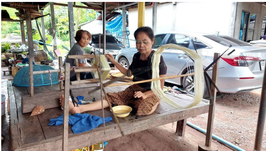
ภาพที่ 4.3 สาวไหม

ระยะทางกว่า 3 กิโลเมตร พร้อมทั้งเขย่า-โยนนาคอย่างรุนแรงเพื่อความสนุกสนาน ทั้งนี้ เชื่อว่าเป็นการทดสอบความตั้งใจของผู้บวชว่ามีความมุ่งมั่นที่จะบวชหรือไม่ โดยนาคต้องห้ามตกลงมาจากแคร่ไม้ไผ่ หากตกลงมาถูกพื้นดินจะถือว่าขาดคุณสมบัติไม่ไหวบวช ดังนั้น ชาวบ้านจึงได้นำประเพณีแห่नाคโหดอันเป็นเอกลักษณ์ที่โดดเด่นของชาวชัยภูมิมาร้อยเรียงบนผ้าฝ้ายเกิดเป็นลายแห่नाคโหดแห่งเดียวประจำจังหวัด