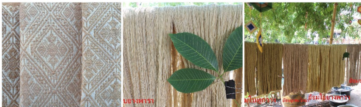
ภาพประกอบที่ 6.9.2 กระบวนการการผลิตผ้าทอขีด ชุมชนโนนเสลา

การย้อมเส้นใยสีธรรมชาติ มีหลักการง่าย ๆ คือ ทูบ สับ ต้ม กรอง ย้อม ต้ม เติมสารช่วยย้อม เกลือแกง มอแดนส์ (mordant) เมื่อได้เส้น สีหลักแล้ว สามารถเอาไปเปลี่ยนสีอื่น ๆ โดยการแช่สารสัลงต่างปูน หมักโคลน หรือน้ำสนิมเหล็ก จะทำให้ได้เฉดสีหลากหลายมากขึ้นเพราะจะต้องให้ลงลายเหมือนกันกับตอนขึ้นต้น