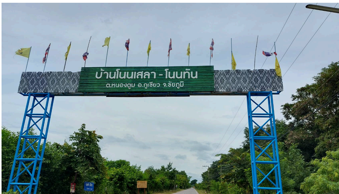
ภาพที่ 4.1 ป้ายหมู่บ้านบ้านโนนเสลา

4.1.1 ผลจากแบบสัมภาษณ์ เรื่อง การศึกษาและพัฒนาภูมิปัญญาเพื่อส่งเสริมการขยายผลิตภัณฑ์ชุมชน : กรณีศึกษาชุมชนแหล่งทอผ้าขิดบ้านโนนเสลา ตำบลหนองตม อำเภอภูเขียว จังหวัดชัยภูมิ