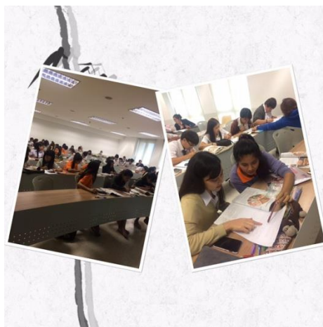
ภาพที่ 4 กิจกรรมการเรียนการสอนและผลงานของผู้เรียนรูปแบบ Tactile Learners

จากการจัดกิจกรรมการเรียนการสอนที่แตกต่างกันตามรูปแบบการเรียนรู้ (Learning Style) พบว่า