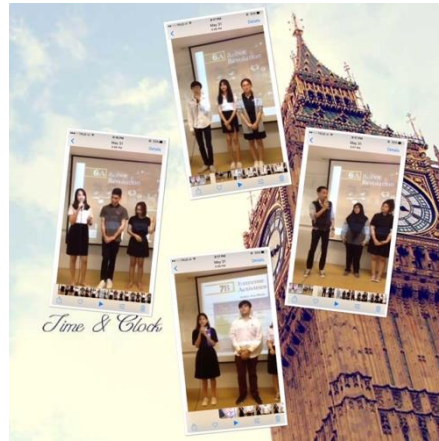
ภาพที่ 2 กิจกรรมการเรียนการสอนและผลงานของผู้เรียนรูปแบบ Auditory Learners

นอกจากนี้ ผู้วิจัยได้รวบรวมภาพกิจกรรมการเรียนการสอนและผลงานของผู้เรียนที่ได้รับการจัดกิจกรรมการเรียนการสอนตามรูปแบบการเรียนรู้ที่ต่างกันของผู้เรียน ตามที่แสดงในภาพ ดังต่อไปนี้