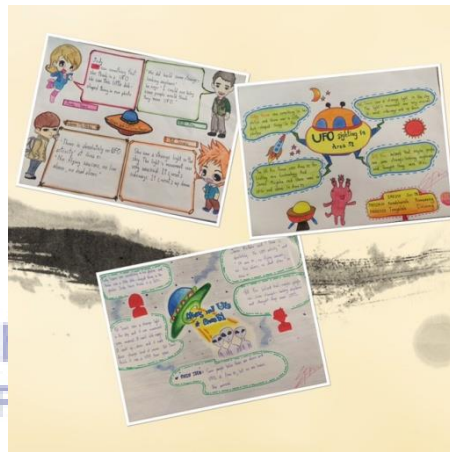
ภาพที่ 3 กิจกรรมการเรียนการสอนและผลงานของผู้เรียนรูปแบบ Visual Learners