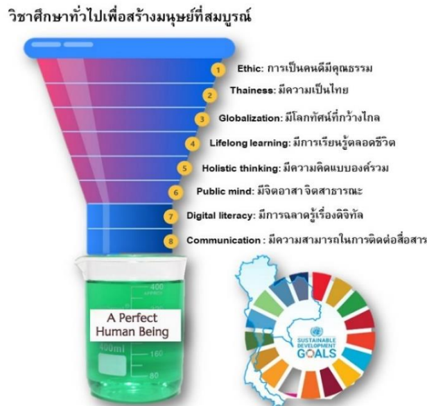
รูปที่ 2 อินโฟกราฟฟิกแสดงวิชาศึกษาทั่วไปเพื่อสร้างมนุษย์ที่สมบูรณ์ (ออกแบบโดย ผศ.กิตติภูมิ มีประดิษฐ์)

ครอบคลุมผลการเรียนรู้ของหมวดวิชาศึกษาทั่วไป 8 ด้าน ทั้งนี้สถาบันอุดมศึกษาหลายแห่งจึงมุ่งเน้นไปที่การเสริมสร้างและบ่มเพาะตามงานวิจัยดังกล่าวซึ่งแบ่งเป็นคุณลักษณะโดยสรุปคือ (1) Ethic: การเป็นคนดีมีคุณธรรม (2) Thainess: มีความเป็นไทย (3) Globalization: มีโลกทัศน์ที่กว้างไกล (4) Lifelong learning: มีการเรียนรู้ตลอดชีวิต (5) Holistic thinking: มีความคิดแบบองค์รวม (6) Public mind: มีจิตอาสา จิตสาธารณะ (7) Digital literacy: มีการฉลาดรู้เรื่องดิจิทัล และ (8) Communication : มีความสามารถในการติดต่อสื่อสาร (รูปที่ 2)