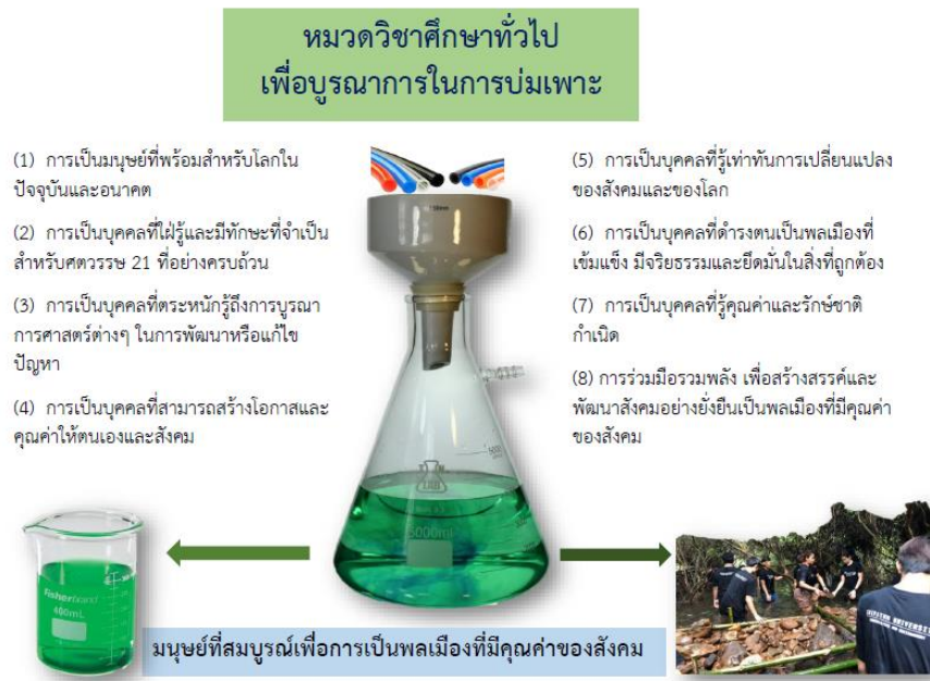
รูปที่ 1 อินโฟกราฟิกความหมายของหมวดวิชาศึกษาทั่วไปตามเกณฑ์มาตรฐานหลักสูตรระดับปริญญาตรี พ.ศ.2565 (ออกแบบโดย ผศ.กิตติภูมิ มีประดิษฐ์)

การจัดการศึกษาในหมวดวิชาศึกษาทั่วไปซึ่งเป็นหมวดวิชาหนึ่งที่ได้รับบรรจุนิยามไว้ในหลักสูตรระดับอุดมศึกษา โดยมีปรัชญาเพื่อให้ผู้เรียนได้เข้าใจตนเอง เข้าใจผู้อื่นและสามารถอยู่ร่วมกับสังคมได้อย่างปกติสุข (Glynn et.al., 2005; O'Banion, 2016) มุ่งพัฒนาผู้เรียนให้มีความรู้อย่างกว้างขวาง มีทักษะการเรียนรู้ที่จำเป็นปรับเปลี่ยนความคิดและโลกทัศน์ให้มีลักษณะองค์รวม (ประสาท เนืองเฉลิม, 2563) สำหรับสถาบันอุดมศึกษาในประเทศไทยจะให้ความหมายของวิชาศึกษาทั่วไป คือ หมวดวิชาที่เสริมสร้างความเป็นมนุษย์ให้พร้อมสำหรับโลกในปัจจุบันและอนาคต เพื่อให้เป็นบุคคลผู้ใฝ่รู้และมีทักษะที่จำเป็นสำหรับศตวรรษที่ 21 อย่างครบถ้วน เป็นผู้ตระหนักรู้ถึงการบูรณาการศาสตร์ต่างๆ ในการพัฒนาหรือแก้ไขปัญหา เป็นผู้ที่สามารถสร้างโอกาสและคุณค่าให้ตนเองและสังคม รู้เท่าทันการเปลี่ยนแปลงของสังคมและของโลก เป็นบุคคลที่ดำรงตนเป็นพลเมืองที่เข้มแข็ง มีจริยธรรมและยึดมั่นในสิ่งที่ถูกต้อง รู้คุณค่าและรักษาชาติกำเนิด ร่วมมือร่วมพลัง เพื่อสร้างสรรค์และพัฒนาสังคมอย่างยั่งยืน เป็นพลเมืองที่มีคุณค่าของสังคม (เกณฑ์มาตรฐานหลักสูตรระดับปริญญาตรี พ.ศ.2565) (รูปที่ 1)