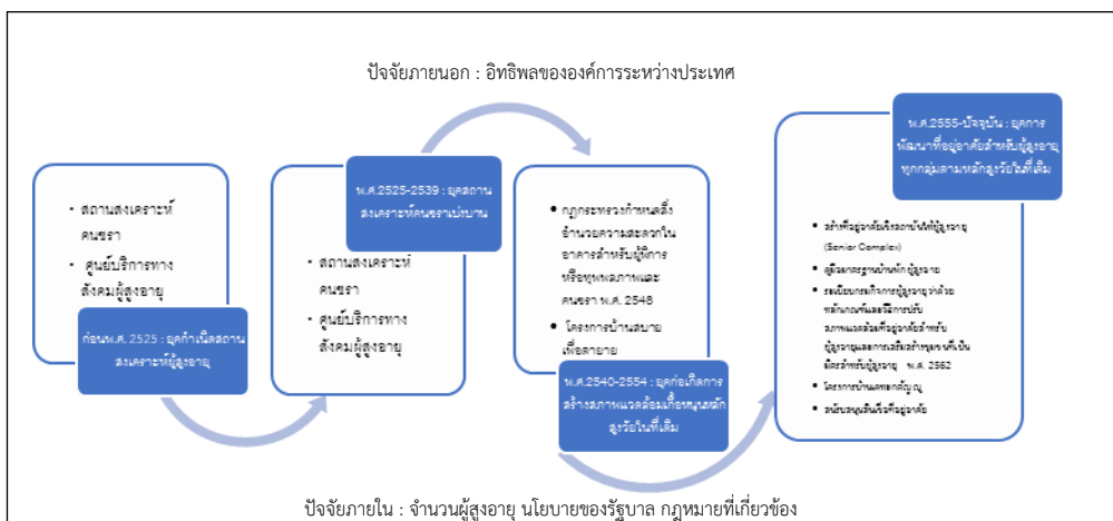
ภาพที่ 2 กระบวนทัศน์นโยบายผู้สูงอายุด้านที่พักอาศัยของประเทศไทย

จากกระบวนทัศน์นโยบายผู้สูงอายุด้านที่พักอาศัยของประเทศไทย สามารถสรุปเป็นภาพที่ 2 ได้ดังนี้